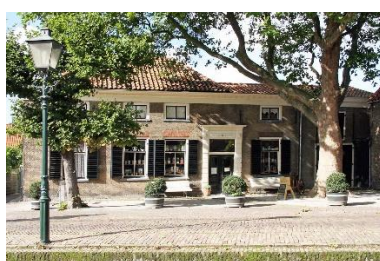
Afb.2 Museum .....