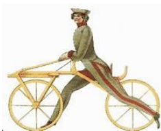
Afb.6. Een loopfiets uit 1817

Tegenwoordig gaat reizen veel gemakkelijker. Er is veel veranderd in waarmee we kunnen reizen en hoe, langs welke routes we kunnen reizen, waarnaartoe we kunnen reizen en wanneer we willen.