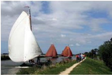
Afb.4 Varende Westlanders