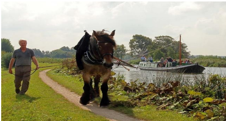
Afb.8. De trekschuit in Midden-Delfland Open Monumentendag 2014

Ook in Midden-Delfland voer de trekschuit. Van en naar Maassluis en naar Vlaardingen en Delft. De snellere aanvoer van vis vanuit Maassluis was heel belangrijk voor Delft. In het landschap zien we nog de bruggetjes, de rollepalen en de jaagpaden die herinneren aan de trekvaart.