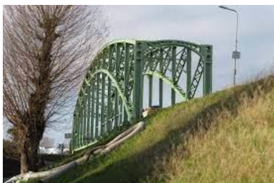
Afb.1. De .... brug