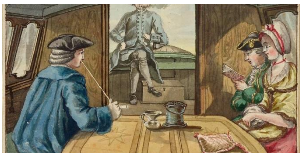
Afb. 10 In de roef van de trekschuit

Vraag 3c Kijk goed naar de mensen in de roef op afb. 10. Wat valt op? (bv kleding)