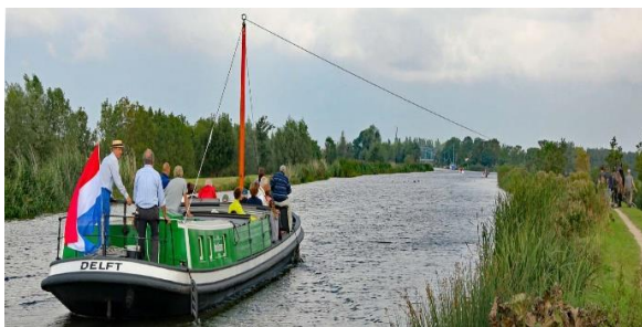
Afb. 9 Een trekschuit

Tip: Vergelijk de trekschuit met andere vervoersmiddelen in die tijd (bijv. paard, rijtuig, zeilschip) en hun snelheid en gemak om mee te reizen.