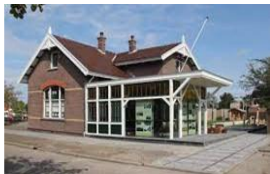
Afb. 12 Museum Het Tramstation nu

Vraag 4a Kijk goed naar de twee afbeeldingen van het WSM-tramstation Schipluiden.