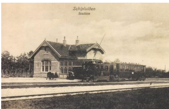
Afb. 11 Tramstation Schipluiden met stoomtram

In het Westland zorgde de Westlandse Stoomtramweg-Maatschappij vanaf 1884 voor de invoering van een stoomtramweg netwerk. Ook in Midden-Delfland werd een tramlijn aangelegd tussen Maasland, Schipluiden, Den Hoorn naar Delft.