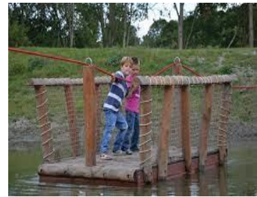
Afb. 5 Doe-het-zelf pontje