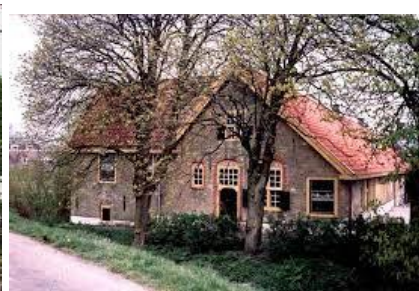
Afb 3 Boerderij Abbestee in