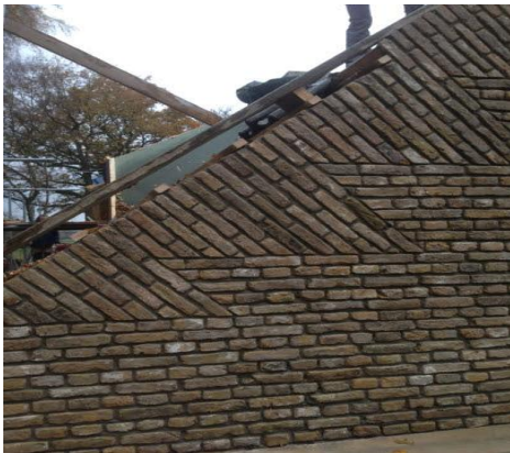
C hoort bij afb. ....