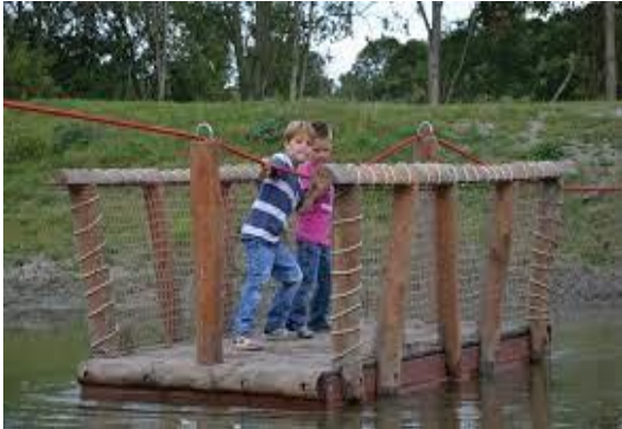
Afb.4 Overvaren op eigen kracht!

2a Wat vind jij het mooiste van Midden-Delfland?