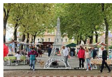
Afb. 7 Montmartre in .....

3c Noem nu nog jouw eigen favoriete traditie of gebruik in je dorp of in Midden-Delfland