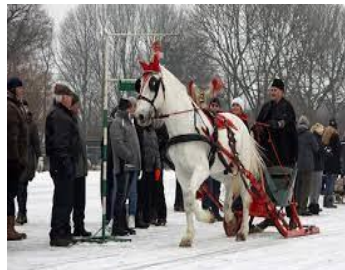
Afb. 6 Ringsteken in.....