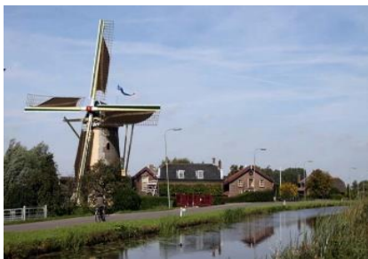
Afb. 1 Molen in

1a In welk dorp liggen de monumenten op de afbeeldingen?