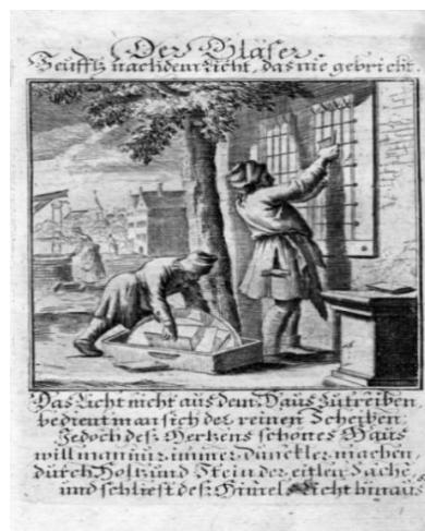
Afb. 11 .....