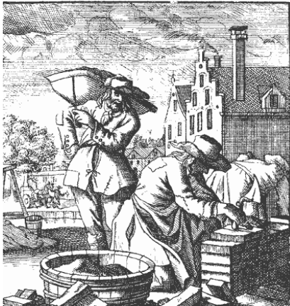
Afb. 8 .....

Kijk goed naar wat de ambachtsman doet en naar de materialen die hij gebruikt.