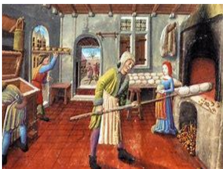
Afb. 12 .....