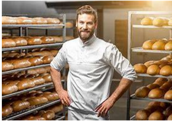
B hoort bij afb. ....