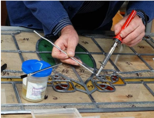
A hoort bij afb. ....

Schrijf het nummer van de afbeelding op pag. 4 (dus 8, of 9 etc.) bij de letter (dus A, of B etc.) van de afbeelding hieronder.