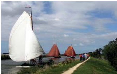
Afb. 4 Westlanders

Erfgoed dus, dat zich kan verplaatsen. Op het water, in de lucht of op de grond.