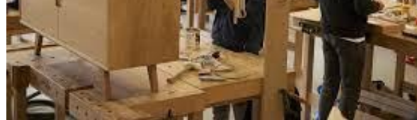
F hoort bij afb. ....