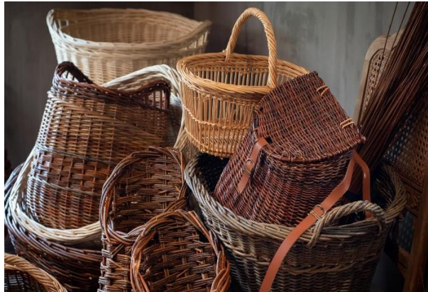
D hoort bij afb. ....