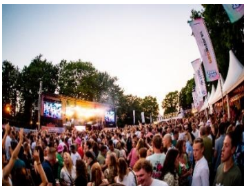
Afb. 5 Sport en Spel in .....