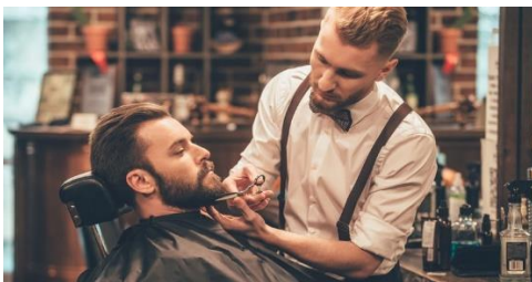
E hoort bij afb. ....