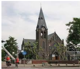
Afb. 2 R.K. kerk in