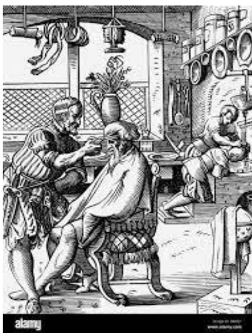
Afb. 10 .....