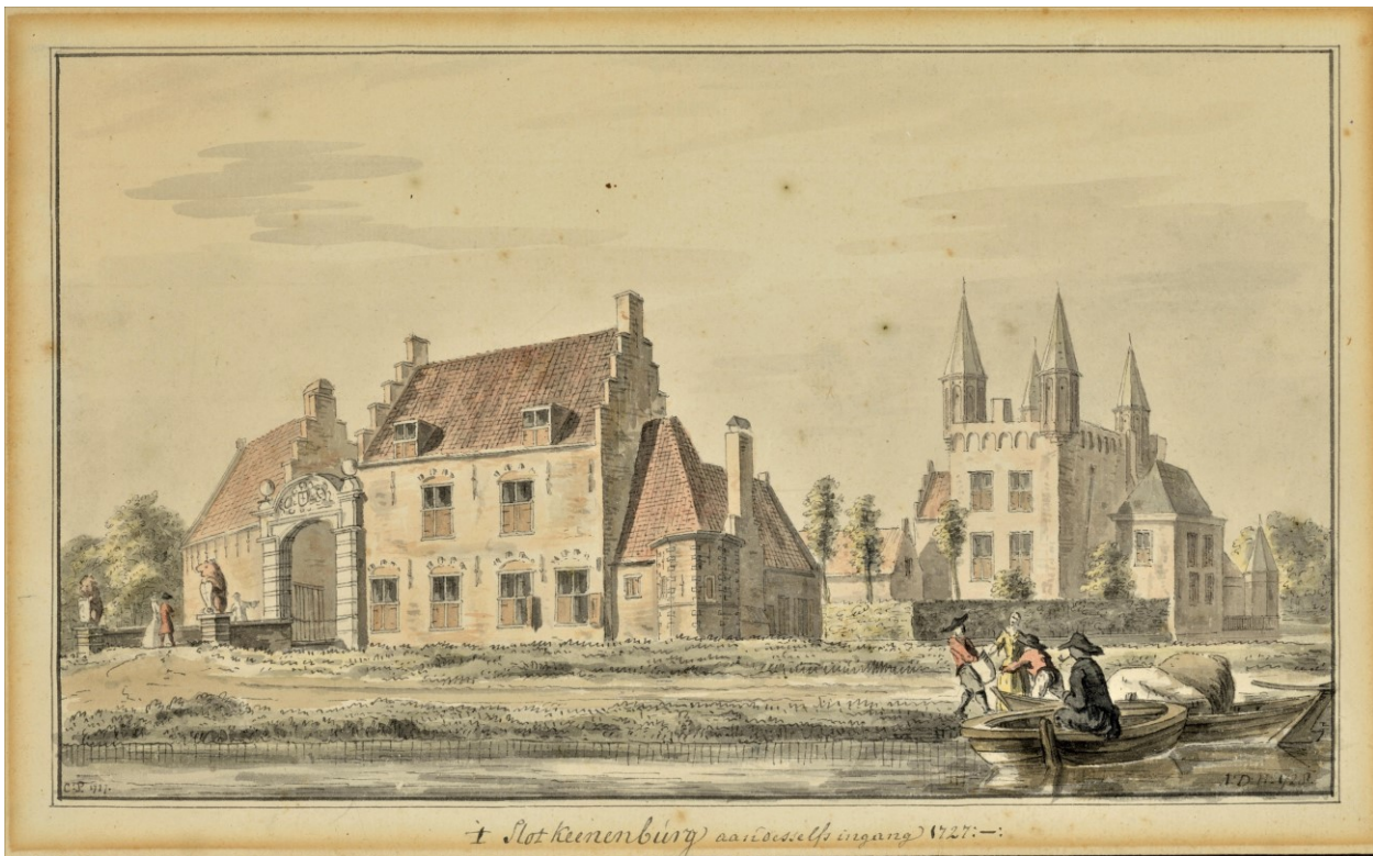
De voorburcht van de Keenenburg in Schipluiden was een geliefde trouwlocatie