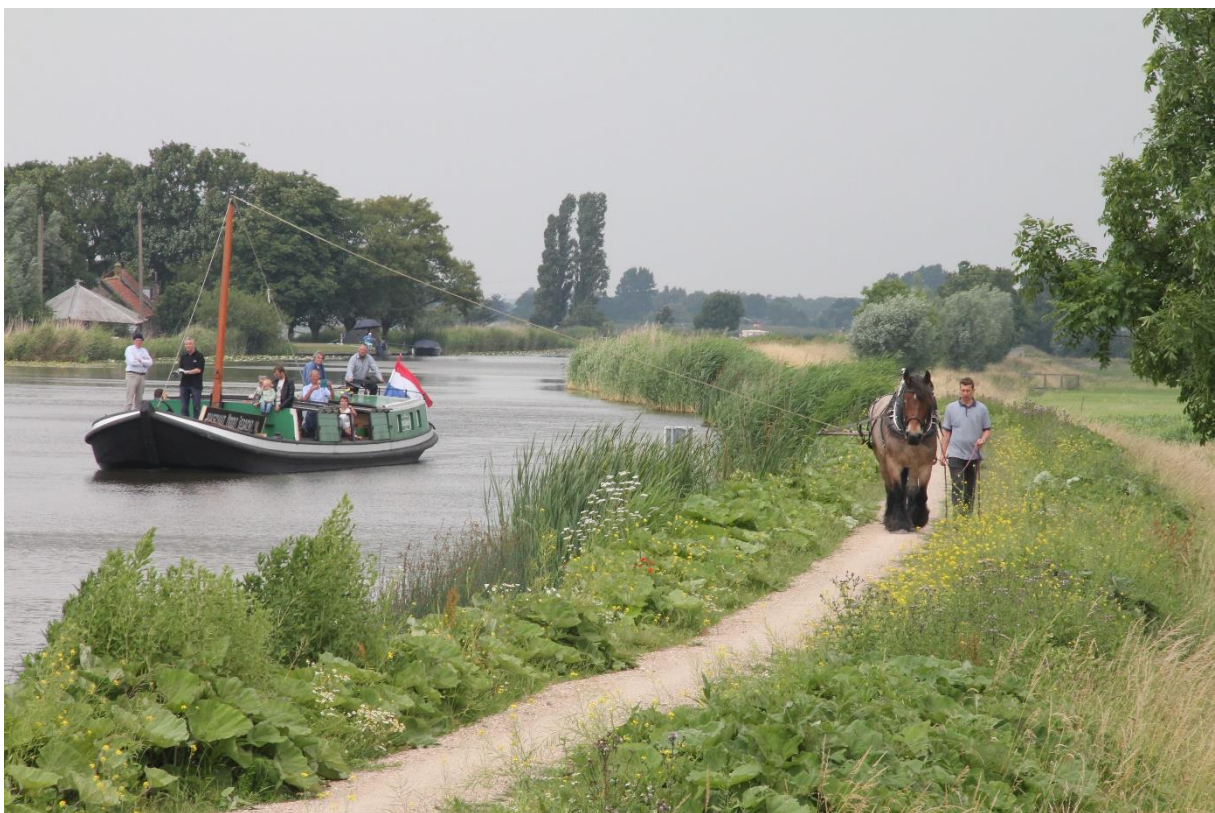
Trekschuit met jaagpaard, Vlaardingse Vaart 2018.

Ook buiten de kerk zijn sporen uit de bloeitijd van de Gouden Eeuw te beleven. Nog altijd is in Midden-Delfland een aantal boerderijen te bewonderen, die in de periode 1625-1665 zijn gebouwd, zoals boerderij Abbestee uit 1646 in Schipluiden, boerderij Meerzicht in Zouteveen, de Lindenhoeve in 't Woudt uit 1665. Investeerders waren vaak stedelingen, die hun geld belegden in grond en de bebouwing op het platteland. Soms vestigden zij op het boerenwerf een tweede woning. Denk aan de Leeuwenwoning in Maasland, bezit van de Delftse juristen- en artsenfamilie Van 's Gravenzande; de familie bouwde een vleugel aan de boerderij om daar in de zomermaanden te recreëren, dichterbij hebben wij het voorbeeld Hodenpijl. In 1634 kocht de Haagse familie Van Wouw hier een boerderij, waarnaast een buitenplaats werd aangelegd. Het complex is bewaard gebleven. Het is nu de Levende Buitenplaats. Een ander voorbeeld is Sion, waar vanuit een boerderij een van de grootste buitenplaatsen van Zuid-Holland werd aangelegd. De eigenaren kwamen uit Rotterdam, de familie Van Hogendorp. Twee stenen hekpalen herinneren in Sion nog aan de buitenplaats, evenals het koetshuis (uit 1700), dat binnenkort wordt gerestaureerd.