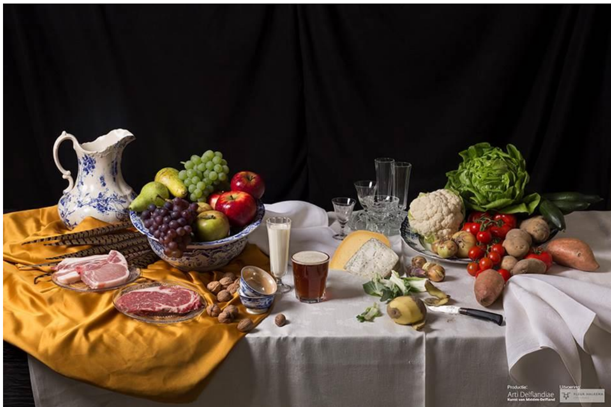
Voedselrijkdom uit Midden-Delfland.

De groeiende welvaart in de Gouden Eeuw betekende een toenemende belangstelling voor kunst. Het aantal genres nam toe, waaronder het schilderen van stillevens. Stillevens werden in de zeventiende eeuw in groten getale vervaardigd. De schilder gaf de voorwerpen op een stilleven zo echt mogelijk weer. Tevens moest hij zorgen voor een goede compositie, zodat alle voorwerpen tot hun recht kwamen. Ook de lichtval was erg belangrijk. Op pronkstilleven zijn weelderige tafels met luxe voorwerpen als geslepen glazen, porselein en exotische vruchten afgebeeld. Op eenvoudige 'banketjes' en 'ontbijtjes' zien we sobere spijzen, zoals kaas, brood en haring, een combinatie van voedsel, dat nauw met deze streek verbonden was en in de Gouden Eeuw bereikbaar werd voor alle klassen. Iedereen in Nederland at boter en kaas. Deze producten stonden niet alleen als ontbijt op tafel, maar waren ook geliefd als laatste gang van een diner. Als dessert kwamen zij op de tafels van de gegoede burgerij, bijvoorbeeld in de Keenenburg te Schipluiden, geserveerd met noten, fruit, zuidvruchten en suikerwaren, zie de voedselresten uit de beerputten van het kasteel, maar bekijk ook de stillevens uit de Gouden Eeuw in de Nederlandse musea.