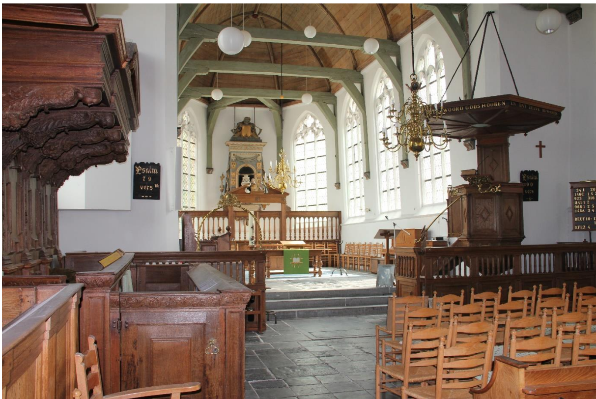
Het rijke interieur van de Dorpskerk in Schipluiden, foto Jacques Moerman.

Is de Gouden Eeuw ook in onze streek, in Midden-Delfland, te beleven?