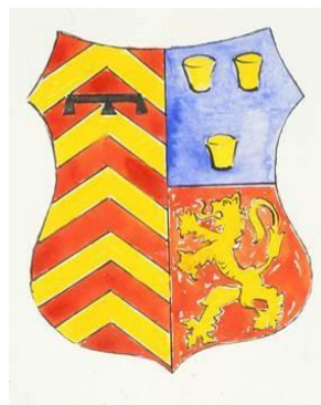
Afb. 8 Familiewapen Agnes Croesink