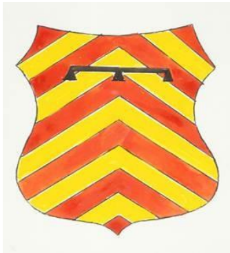
Afb. 7 Familiewapen Otto van Egmond

Hieronder zie je twee familiewapens. Het linker wapen is van kasteelheer Otto van Egmond, het rechter wapen is van zijn echtgenote, Agnes Croesink.