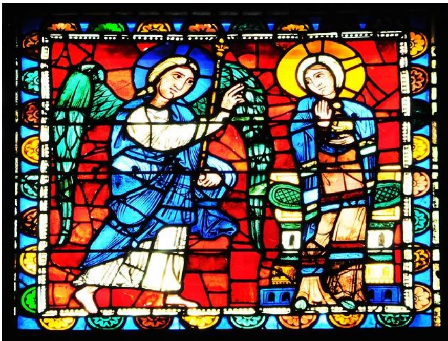
Afb. 17 gebrandschilderd raam met Aankondiging

In de gebrandschilderde ramen van die tijd waren verhalen uit de Bijbel uitgebeeld. De verhalen werden uitgebeeld op de ramen of op muurschilderingen of schilderijen in de kerk. Zo kregen de gelovigen een goede voorstelling van de verhalen uit de Bijbel.