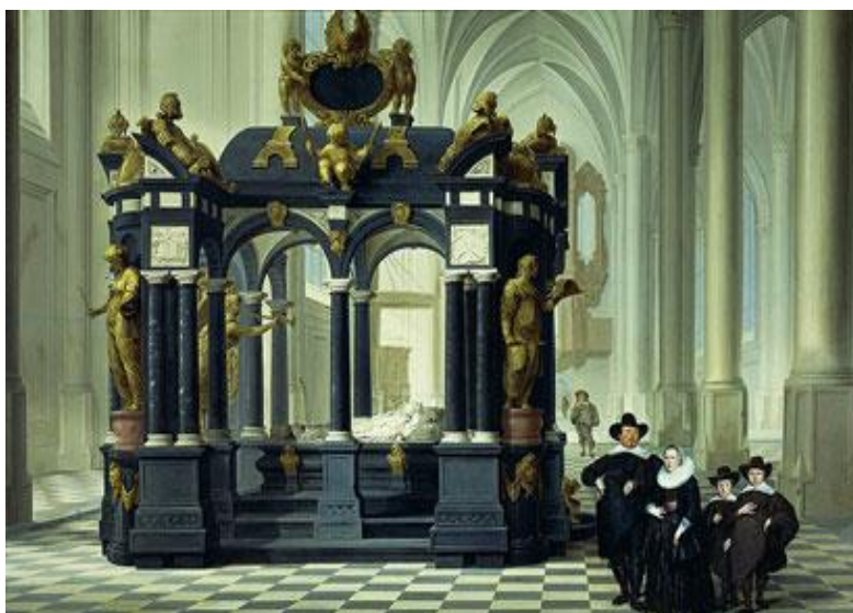
Afb.21 Praalgraf van Willem van Oranje (Nieuwe Kerk, Delft)

Op het schilderij hierboven zie je het praalgraf van Willem van Oranje. (Zie je hem liggen?)